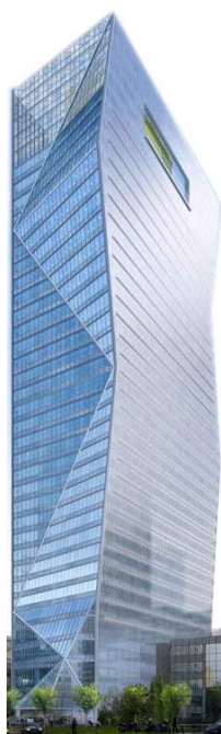
Robert A.M. Stern Architects & SRA Architectes

« Tour Carpe Diem » à La Défense : 1 ère tour en France à s'inscrire dans une démarche de double certification environnementale HQE® et LEED® Gold